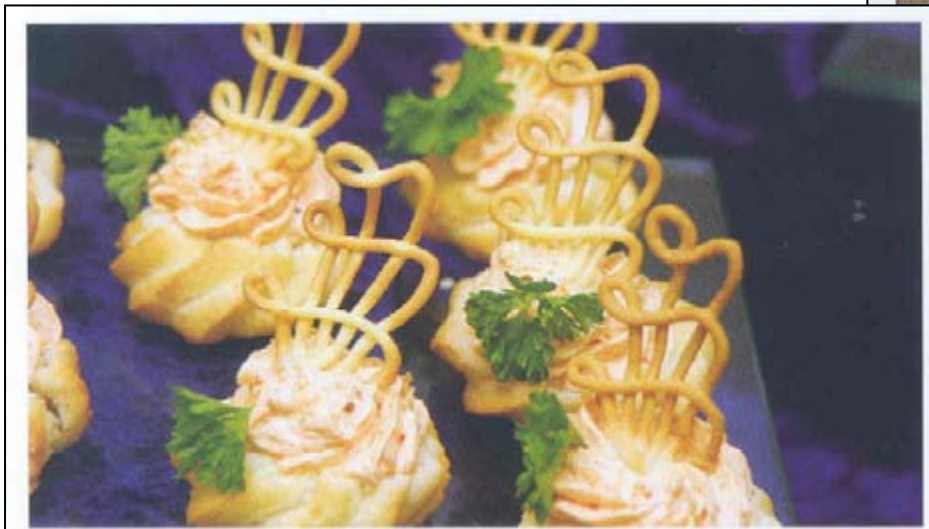
Pikante Fours mit feinen Verzierungselementen.